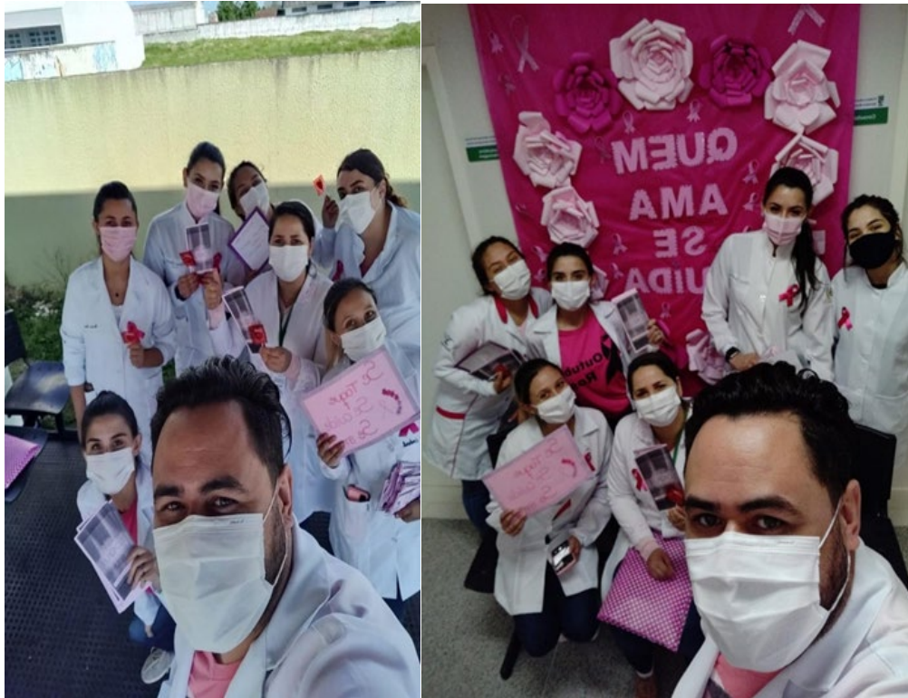
2.1) Outubro Rosa nas escolas municipais de Pinhais. Realizado Palestras em duas escolas municipais pelos acadêmicos de enfermagem do 7º período.